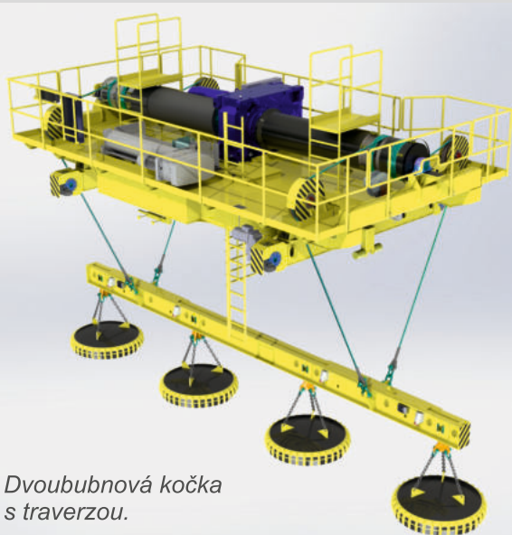
Dvoububnová kočka s traverzou.