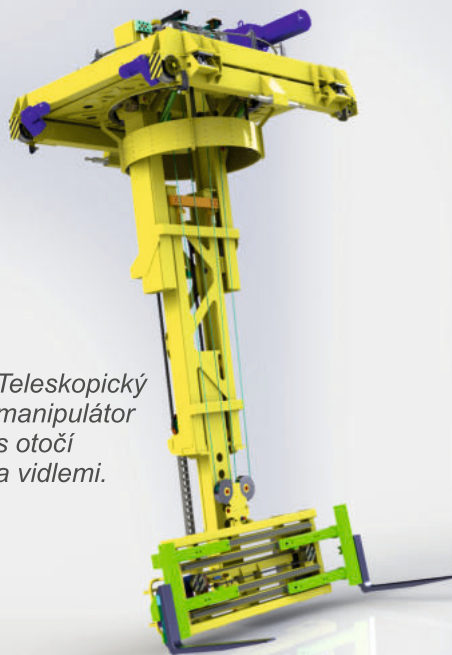
Teleskopický manipulátor s otočí a vidlemi.