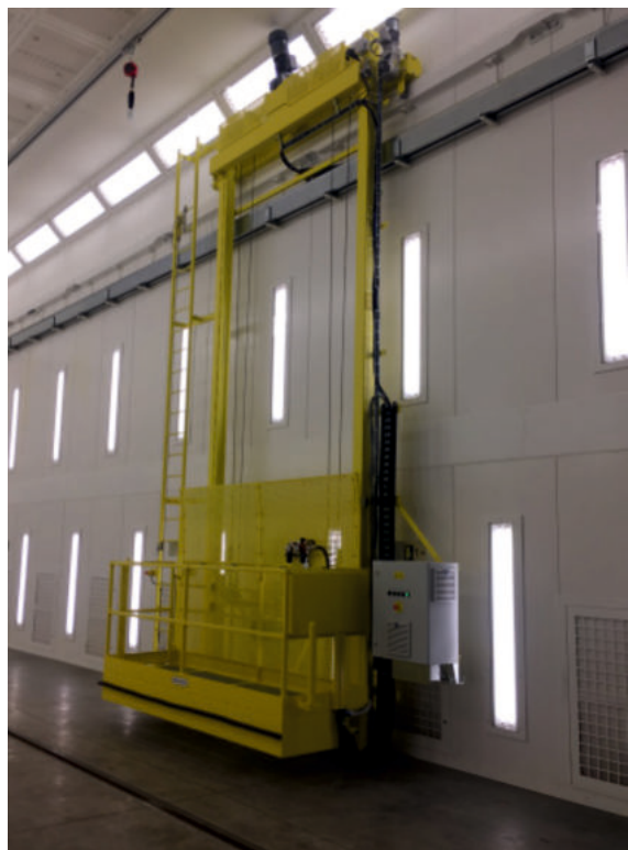
Elektrická plošina s vrátky.