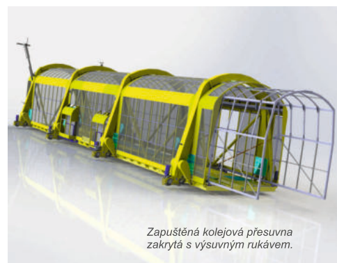
Zapuštěná kolejová přesuvna zakrytá s výsuvným rukávem.