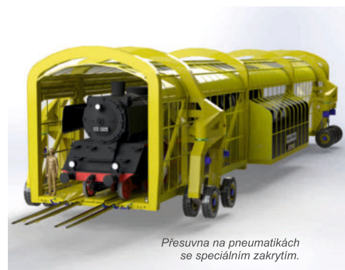
Přesuvna na pneumatikách se speciálním zakrytím.